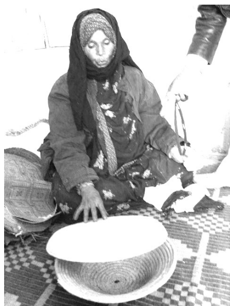
Une femme montre son travail à un acquéreur.