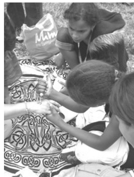
Tatouage au henné

Toutes ces actions sont réalisées grâce à vos dons et à votre adhésion ; aux subventions accordées par le Haut Commissariat aux Réfugiés, la Fondation Princesse Grace de Monaco, le Conseil Général de L.A, le Conseil Régional des Pays de la Loire, la ville de Rezé et la Fondation japonaise d'aide aux réfugiés( RIJ ).